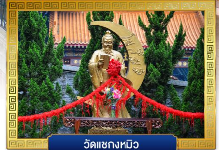
วัดเซกหมีว